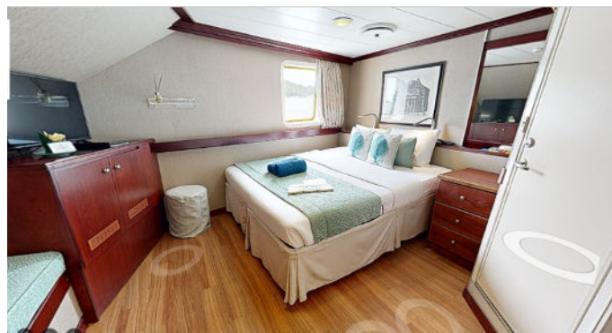
Catégorie P: situé au pont principal - lit double 205 pieds carré