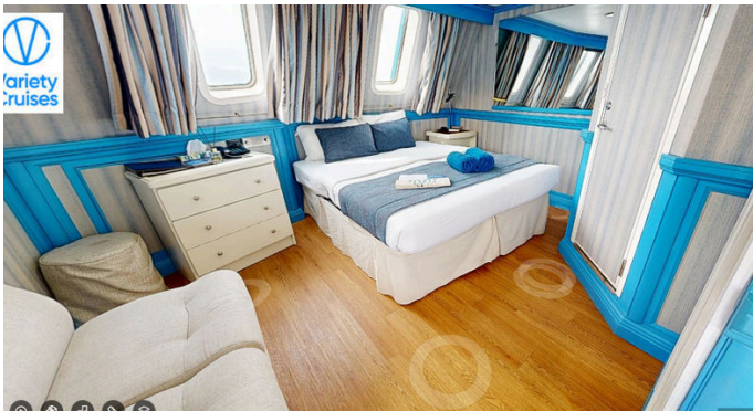
Catégorie B: situé au pont principal et "sun deck" - lit double ou 2 lits simples - 124 à 195 pieds carré

Toutes les cabines comprennent : une fenêtre, une salle de bain complète, l'air climatisé, une télévision, un coffre de sécurité, un mini-frigo et un séchoir.