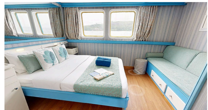
Catégorie A: situé au pont principal et pont supérieur - lit double ou 2 lits simples - 173 à 205 pieds carré